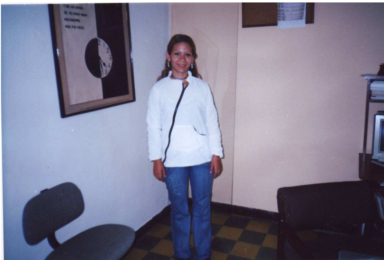
Bild 7, 8: Design-Kurs, wo sie lernen, eigene Modelle zu entwerfen; diese haben sie selbst entwickelt.