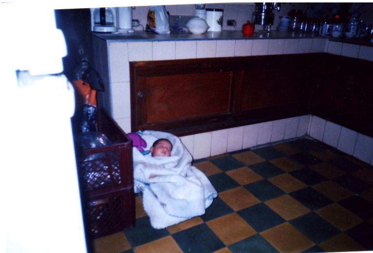
Bild 1: Während ich in der Küche der Fundación schlafe, macht meine Mama hier eine Ausbildung, damit sie mir eine bessere Zukunft geben kann. Danke für euere Hilfe, meine Freunde.

Ganz, ganz herzlichen Dank für euere Spenden. Mit ihnen ist es möglich, diesen kleinen Raum zu schaffen, der für uns wie ein Stück vom Himmel ist, wo wir alle Platz haben. Das ist es, was wir alle brauchen.