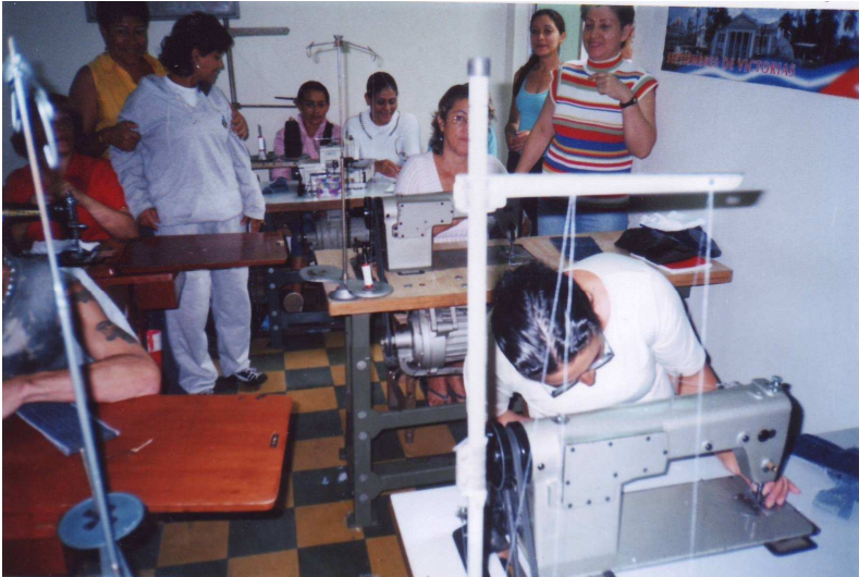
Bild 6: Viele Familien verdienen von hier aus ihren Lebensunterhalt