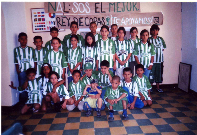
Bild 2: Das Sportprojekt hat uns geholfen, die Kinder von der Straße zu holen, wo die Gefahr der Drogen und der Prostitution lauert.